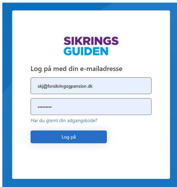
Figur: Log-in billede på Sikringsguiden.dk

Log-in vil herefter ske via login-manden i øverste højre hjørne på Sikringsguiden.dk med en registreret mailadresse og kodeord.